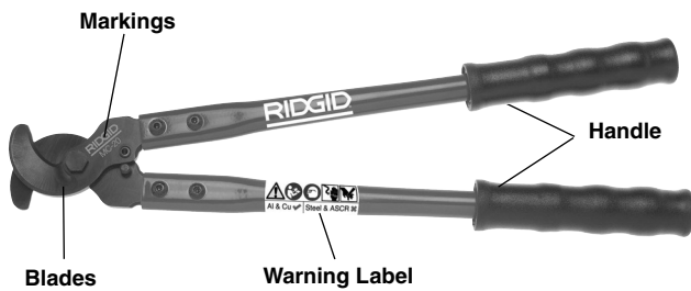
Figure 1 – Manual Cable Cutters (Model MC-20 Shown)