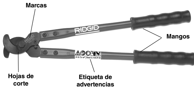
Figura 1 – Cortadora de cables manual (se muestra el Modelo MC-20)