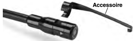
Figure 5 – Montage des accessoires

Pour ce faire, tenez la tête de caméra comme indiqué à la Figure 5, engagez la bride de l'accessoire sur la partie à méplats de la tête de caméra, puis tournez l'accessoire d'un quart de tour de manière à ce que l'accessoire soit orienté comme indiqué.