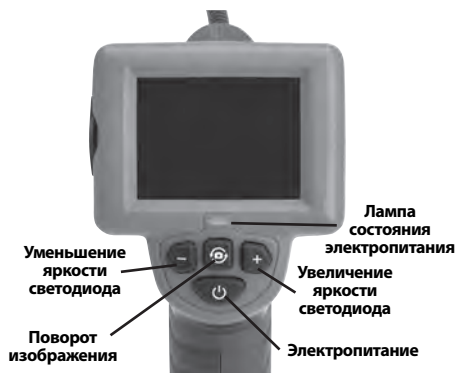
Рис. 7 – Средства управления