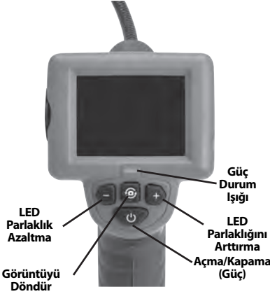
Şekil 2 - Kumandalar