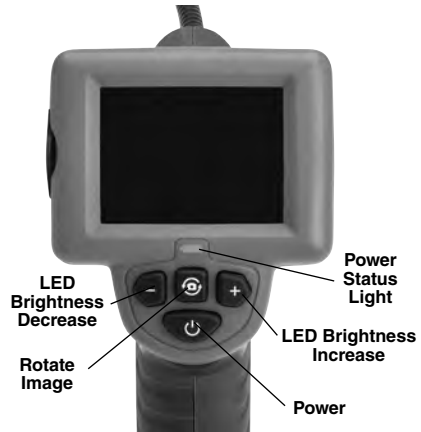
Figure 2 – Controls