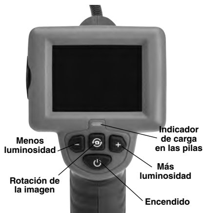
Figura 2 – Mandos