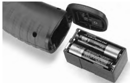
Figure 4 – Battery Compartment