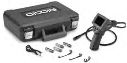
Figure 1 – micro CA-25