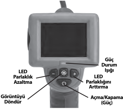
Şekil 7 – Kumandalar