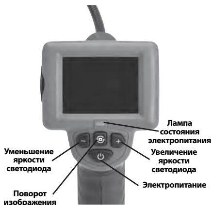
Рис. 2 – Средства управления