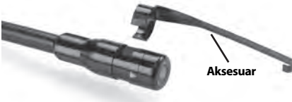
Şekil 5 – Aksesuarların Yerleştirilmesi

Bağlamak için, kamera kafasını Şekil 5 üzerinde gösterildiği gibi tutun. Aksesuarın yarım daire ucunu, Şekil 5'te gösterilen şekilde kamera kafasının içerisine kaydırın. Daha sonra aksesuarın uzun kolu gösterildiği gibi uzanacağı şekilde aksesuarı 1/4 tur döndürün.