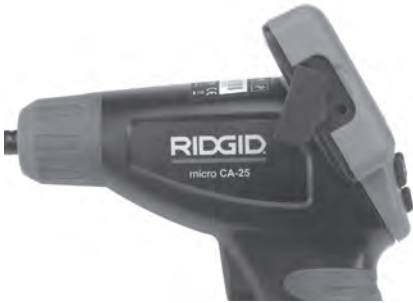
Рис. 8 – Разъем TV-OUT

Вставьте другой конец кабеля в гнездо видеовхода телевизора или видеомонитора. Возможно, для просмотра изображения на телевизоре или видеомониторе придется включить соответствующий вход видеосигнала.