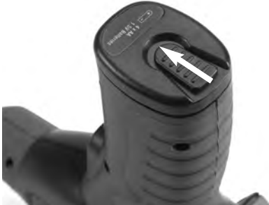
Figure 3 – Couvercle du logement de piles