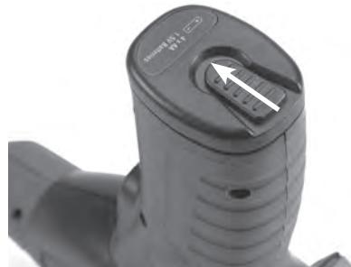
Рис. 3 – Крышка батарейного отсека