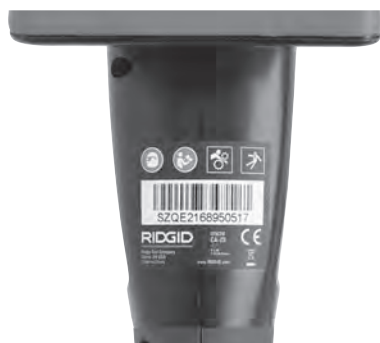
Рис. 6 – Предупредительная этикетка