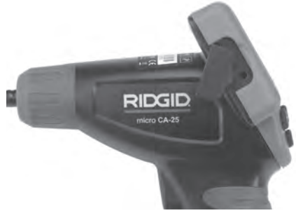
Şekil 8 – TV-ÇIKIŞ Jaki

Diğer ucunu, televizyon veya monitör üzerindeki Video Giriş yakına takın. Televizyon veya monitörün, görüntü alımını sağlamak için doğru girişe ayarlanması gerekebilir.