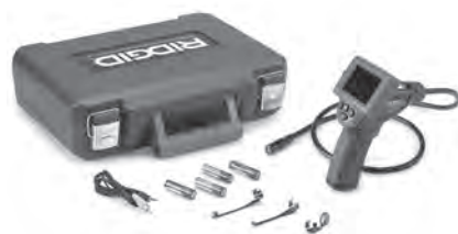
Рис. 1 – Инспекционная видеокамера micro CA-25