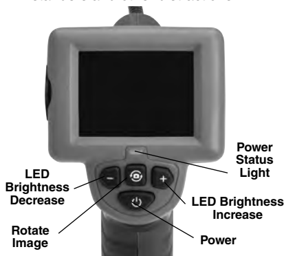
Figure 7 – Controls