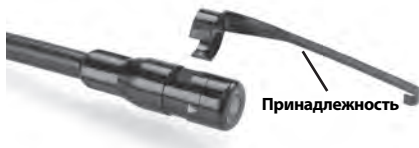
Рис. 5 – Установка аксессуаров

Чтобы прикрепить приспособление, необходимо удерживать головку формирования изображения так, как показано на рис. 5. Вставьте полукруглый конец приспособления на лыску головки формирования изображения, как показано на рис. 5. Затем поверните приспособление на 1/4 оборота так, чтобы его длинная ручка выдвигалась наружу, как показано на рисунке.