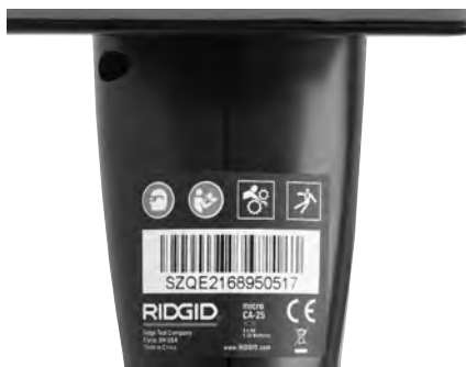
Figure 6 – Etiquette de sécurité