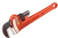
Klucze proste do prac przy dużym obciążeniu