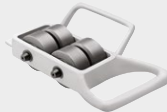
Rouleau de tube pour chanfreinage (Modèle 258 seulement)