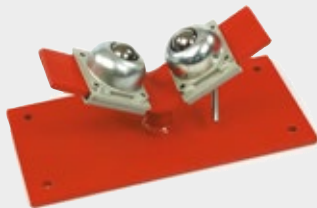
Servante de tubes à bille