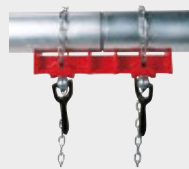
Étau pour soudage de tubes en ligne