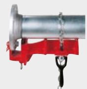
Étau pour soudage de brides