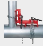
Étau pour soudage de tubes en angle