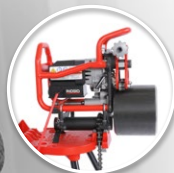
Support de montage TBM-36

Remarque: Application, matériaux, diamètre du tube, épaisseur du tube, revêtement du tube etc. sont des facteurs qui détermineront la durée de vie des lames. La tête de coupe et les lames ont été optimisées pour des tuyaux en acier doux standard A53. Le chanfreinage d'autres types de matériaux risque de réduire la durée de vie des lames.