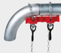
Étau pour soudage de coudes