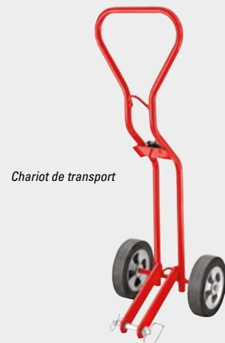
Chariot de transport

(TOOLTIP) Lorsque vous utilisez les coupe-tubes 258 et 258XL avec des longs tubes, vous devez impérativement soutenir correctement le tube pour éviter d'endommager la molette. Des servantes de tube supplémentaires peuvent s'avérer nécessaires et la zone de travail doit être de niveau.