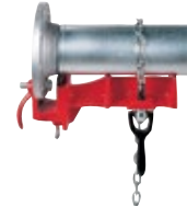
Modèle 461 / 462 / 463 / 464 Etaus pour soudage de tubes en ligne et en angle, pour soudage de coudes et de brides N° de Catalogue 40220 / 40225 / 40230 / 40235