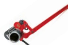
Rørtænger med udveksling