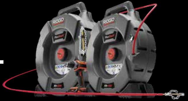
K9-204 MACHINE 64278

Use below table for recommended options based on blockage, pipe size and pipe type.