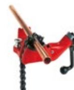
Morse a catena da banco