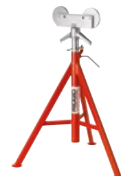
Cavalletti per tubi con supporto a dischi rotanti