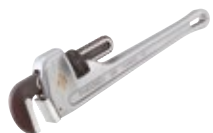
Giratubi dritti in Alluminio