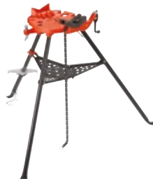
Banco con morsa a catena portatile TRISTANDS®