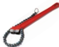
Giratubi a catena