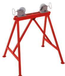
Cavalletto per tubi a dischi rotanti regolabili