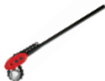
Giratubo a catena con ganasce reversibili