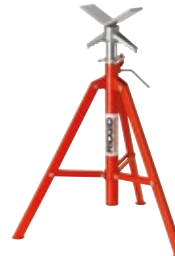
Cavalletti per tubi con supporto a V