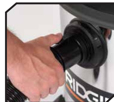
Manguera de fijación Dual-Flex™