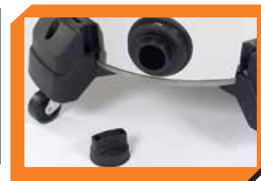
Drenaje grande para vaciar de agua la aspiradora