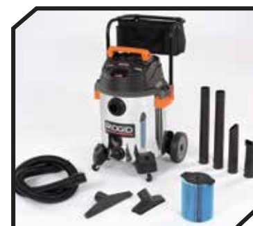
Aspiradora con accesorios y filtro