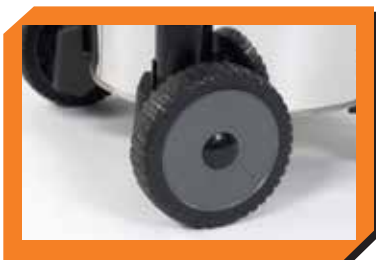
Ruedas traseras: Movilidad en terreno desigual