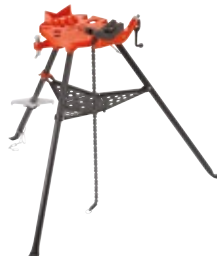
TRISTANDS® draagbare pionierwerkbanken