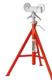
Pijpsteunen met rolkop