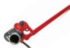
Tangen met meervoudige hefboomwerking