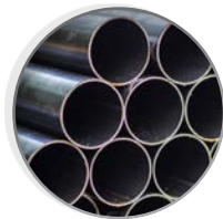
Acero al carbono