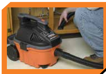
Recolección de Residuos húmedos, taller, fregaderos, etc