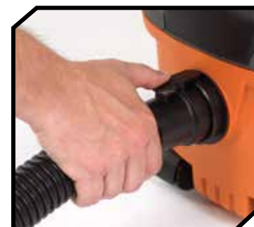
Manguera arrastrable de fijación