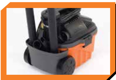
Base de soporte incorporada para almacenar accesorios