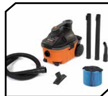
Aspiradora con accesorios y filtro