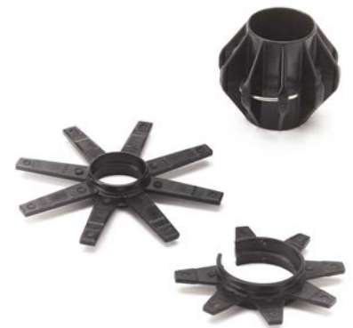
Conjunto de guías de 30 mm incluidas con el carrete SeeSnake Mini