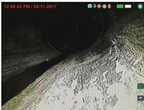
NO - IMAGEN HDT