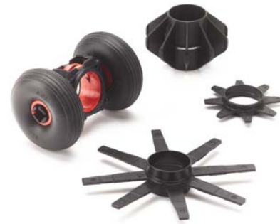
Conjunto de guías de 35 mm incluidas con el carrete SeeSnake Estándar