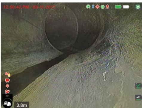
IMAGEN HDR Y TiltSense™