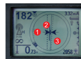
全向探测式屏幕显示：可探测多条管线(最多三条) ①②③

实时显示全面的管线探测和定位的信息 当参数(目标接近参数、电流强度、信号强度)数值不断上升，表明您在不断接近目标管线； 当管线转向时，屏幕图示管线也会随之转向，屏幕导向箭头将即时显示左右走向